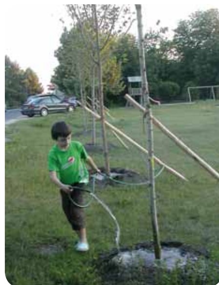
Beide sollen wachsen und gut gedeihen

Ebreichsdorf nicht entsprechend gepflegt wurden, müssen bedauerlicherweise einige von ihnen gefällt werden. Zu enger Bestand, hoher Totholzanteil, sorgloser Umgang im Wur-