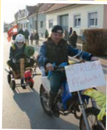
Der Faschingsumzug lockte zum Ausklang des heurigen Faschings viele Besucher auf den Hauptplatz nach Weigelsdorf.