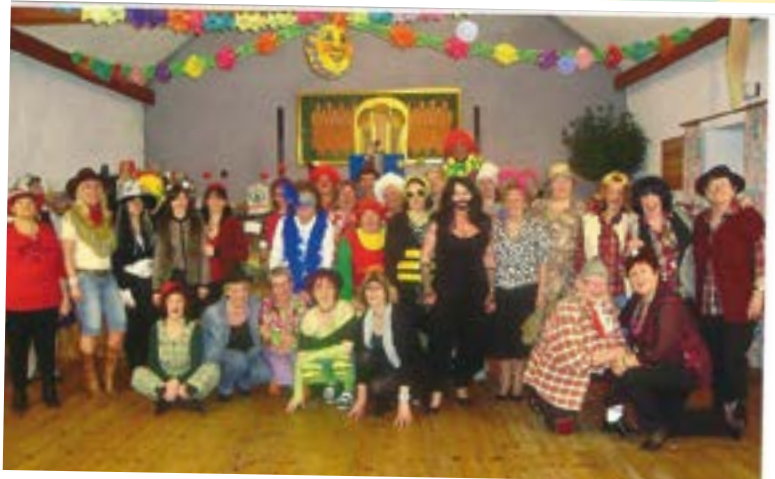
Am Freitag, den 6. Feber fand im Gasthaus zum Weißen Schwan der Ebreichsdorfer Weiberball statt. Sowohl Jung als auch Alt feierten ausgelassen bis in die Morgenstunden in einem gut gefüllten Ballsaal.