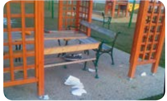
Beispiele neuer Aktivitäten von Vandalismus: Volksschule Ebreichsdorf-Parkplatz, alter Sportplatz-Zaun, Kantine-Weigelsdorf, Sportzentrum-Spielplatz, Unterwaltersdorf-Spielplatz

nahme der Renovierungskosten auch zusätzlich einen Sozialdienst für eine gewisse Zeit zu übernehmen haben.