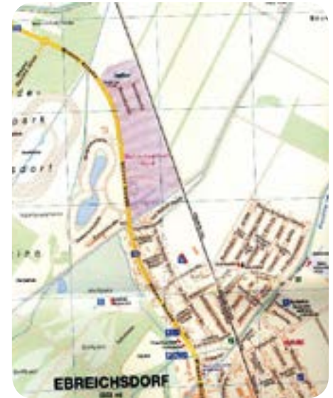
Ausschnitte aus zwei alten Karten und der neue Stadtplan von Ebreichsdorf.