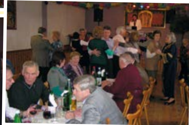
Auch die Rosenmontagsfeier für Pensionisten der Stadtgemeinde war gut besucht.